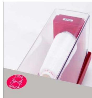
YRS®-透过RFID技术保护客户质量标准的终极系统

该机器具有3个预设程式, 可以快速轻松地更改绕钮脚选项, 并辅以绕钮序列程序(PS), Ascolite (YRS) 纱线识别系统, 确保了钮脚绕扣的最佳效果。