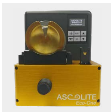
Fourchette de thermocollage en position ergonomique