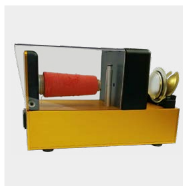
YRS® – moyen sublimé à garantir la qualité du fil

La nouvelle position ergonomisée de la fourche chauffante accélère le processus de travail et atteint un thermocollage maximal du fil Ascolite. L'antenne à reconnaissance du fil (YRS) assure les meilleurs résultats pour la sécurisation des boutons.