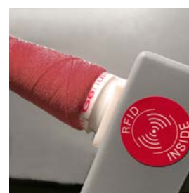
YRS® – per garantire la qualità dell'avvolgimento, con Tecnologia RFID

La nostra macchina ha 1 programma preimpostato, ideale per la maggior parte dei tipi di bottoni e rapidamente adattabile, integrato dal programma sequenziale (SP). Il collaudato sistema di riconoscimento del filo Ascolite YRS garantisce i migliori risultati per l'avvolgimento dei gambi dei bottoni.