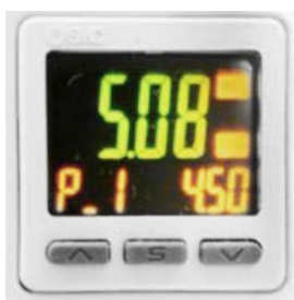
Manómetro pressão do ar digital, evita erros