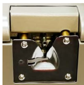
Enfiador automático e monitor de linha (YSM)