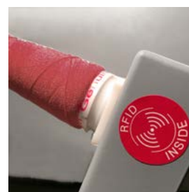
YRS® – o nosso próprio sistema de garantia de qualidade ao serviço do cliente, com tecnologia RFID