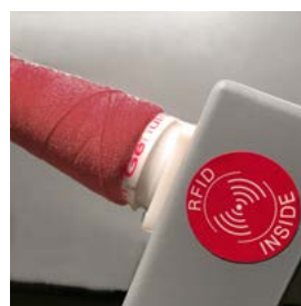
YRS® – il nostro sistema di garanzia della qualità al servizio del cliente, con tecnologia RFID