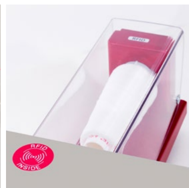
YRS® - Das System zur Sicherung des Kunden-Qualitätsstandards

Dank der neuen Positionierung können Sie schneller, ergonomischer und präziser arbeiten und können Ihren Knopfstiel zuverlässig verschweissen. Das bewährte YRS Garnerkennungs-System garantiert eine optimale Knopfstielumwicklung.