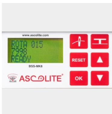
Benutzerfreundliche LCD Anzeige

Unsere Maschinen sind in der Schweiz konzipiert und in Italien hergestellt, in Übereinstimmung mit den Grundnormen der folgenden Europäischen Direktiven: EEC General Directive 93/68/EEC, DIRECTIVE 2006/42/EC (Maschinen), DIRECTIVE 2004/108/EC (Elektromagnetische Kompatibilität), DIRECTIVE 2006/95/EC (Niederspannung) nur für Maschinen in sicheren Umgebungen.